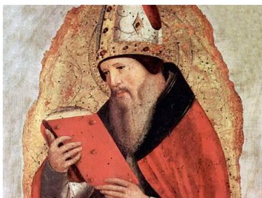
Een van de afbeeldingen van St. Augustinus van Hippo

Elke heilige heeft een verleden, elke zondaar een toekomst.