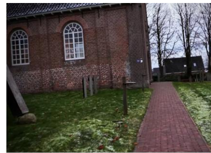
святкування різдва україна

Vorige week schreef ik over de kerstdienst voor Oekraïense vluchtelingen vanuit de kerk van Donkerbroek, waaraan ook Alex meewerkt. De viering staat nu op YouTube: святкування різдва україна - YouTube Het blijft wringen, de Oekraïense tekst bij de Friese kerk. Hoe mooi de viering ook is, laten we bidden dat er een oplossing komt voor deze oorlog, zodat ieder weer kerst kan vieren waar hij of zij dat wil.