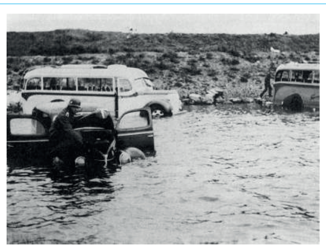
Een Duitse soldaat bij enkele in het IJsselmeer gereden voertuigen. Foto genomen na de capitulatie.